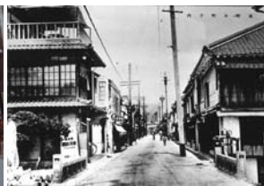
旧内子本町1 (昭和46年) ↓