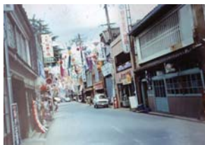
旧内子本町3 (昭和46年) ↓

5月1日。皇太子殿下のご即位に伴い、新元号「令和」(れいわ、Reiwa)が用いられることとなりました。近代は明治から始まった元号も大正、昭和、平成から数えて5つめの元号を迎えるにあたり、私たちの町を昔の様子と比較してみたいと思います。なお、写真については一部撮影者不明のため掲載許可を得られていないものがあります。ご了承ください。