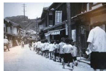
旧大瀬本町 (昭和35年) ↓