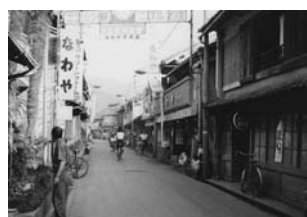
旧五十崎 (昭和46年) ↓