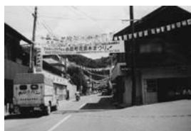
旧小田本町 (昭和38年)