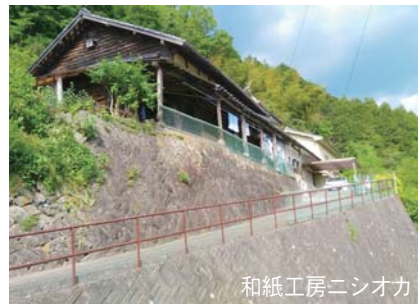
和紙工房ニシオカ