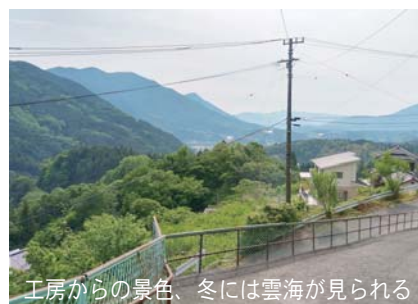
工房からの景色、冬には雲海が見られる