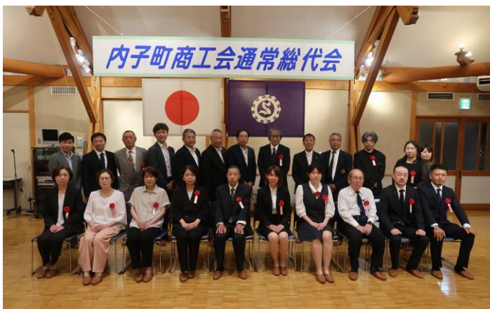
会長・副会長と優良従業員被表彰者、事業主の皆様

強化し、県外・海外からの交流人口を増やし、地域内でお金が循環する仕組みづくりを進めていくことが重要である。」と述べ、挨拶しました。