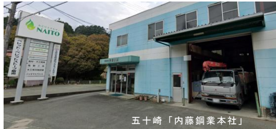
五十崎「内藤鋼業本社」

A はい。弊社では2002年頃、廃材を再生した木質ペレット事業に取り組み、ペレットストーブやペレットプラント等の取り扱いを開始しました。当初は知名度も無く厳しい戦いを強いられました。環境意識の高まりと共に徐々に浸透し、今では