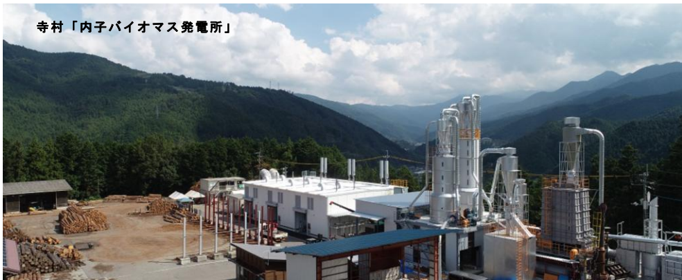
寺村「内子バイオマス発電所」

小学校等、町の施設でも幅広く利用頂いています。また松山平和通りにも常設ショールームを開設いたしました。