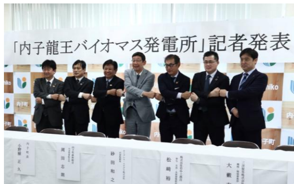
「内子龍王バイオマス発電所」記者発表

018年から稼働開始しました。出力規模2メガワット未満の商用小型バイオマス発電所は四国初の施設です。その後、大手ゼネコン「竹中工務店」等の協力を受け、2022年、「内子龍王バイオマス発電所」を稼働開始しています。