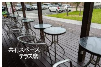
共有スペーステラス席